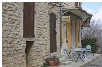
"Bistrot de pays" : café, restaurant multiservices (Vachères)

Les collectivités ont un rôle clé dans le maintien d'équipements et de services en centre ancien (locaux associatifs, médiathèque, clubs pour enfants ou personnes âgées, maison de santé, mairie ...) sans lesquels il est difficile de maintenir ou d'attirer des habitants.