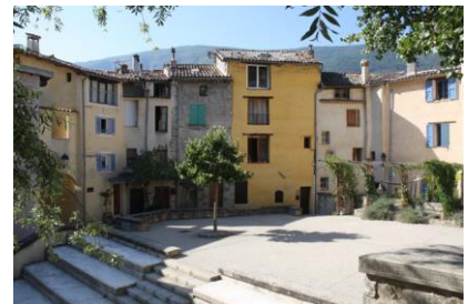
Réhabilitation ou opération de rénovation en cœur de village (Annot)

La perte de population, le vieillissement et la paupérisation des centres anciens alertent à présent autorités et élus. Initier une politique de revitalisation des centres anciens suppose de questionner l'attrait et les usages perdus ou en péril, mais également de trouver un nouveau souffle pour un développement communal durable, qui mette un terme à un étalement urbain, banalisant et consommateur d'espace.