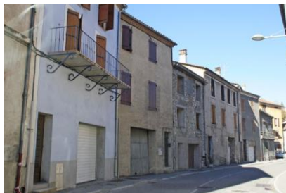
Beaucoup de logements fermés et non restaurés en centre ancien (Barrême)