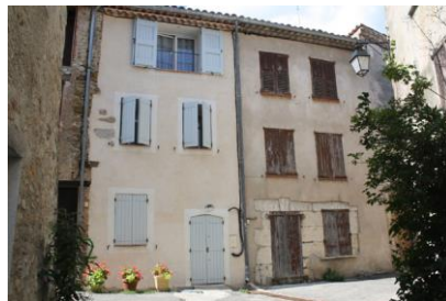
Des façades restaurées ou non, au gré d'initiatives privées (La Palud/Verdon)