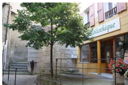
Equipement public maintenu en centre ancien (bibliothèque d'Annot)