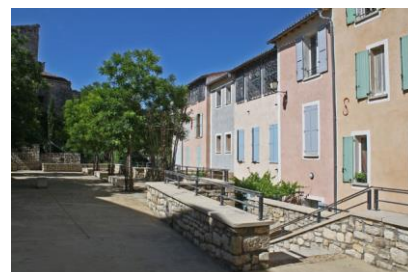
Requalification d'îlot, création d'habitat social et d'espaces publics (Forcalquier)