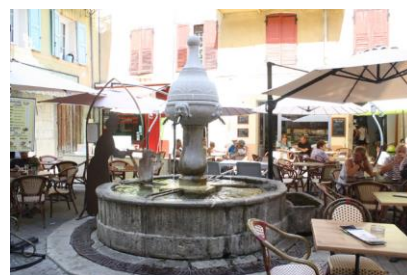
Placette, fontaine et terrasse de bar en centre ancien (Castellane)

Pour que les rues et les places retrouvent leur fonction de déplacement, rencontre, repos ... il est important de reporter le stationnement sur des parkings relais périphériques. Le fleurissement de devant de porte, l'ombrage des places et des rues, la restauration des fontaines et lavoirs, la réfection des revêtements de sol et l'enfouissement des réseaux sont des actions à mener pour redonner qualité et attractivité au paysage urbain.