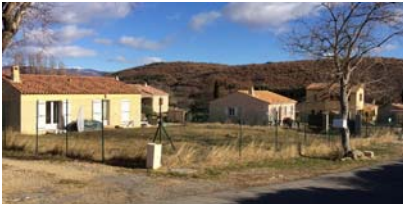
Pavillons près du hameau Les Rivarels