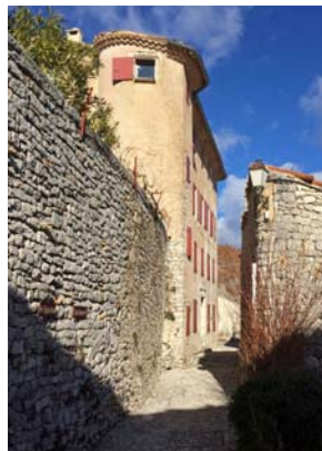
Hôtel-Dieu, construction du 14 et 15 ème , hôpital au 19 ème