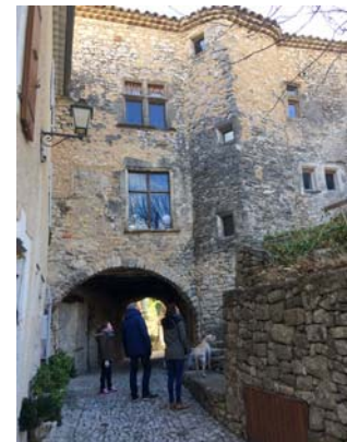
Maison du 16 ème siècle avec fenêtre à meneaux et tour