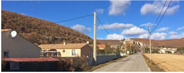
RD 51 depuis le sud bordée de lotissements et réseaux aériens qui brouillent la mise en scène du village perché

Dissémination du bâti au pied du village et le long des routes en rupture avec la silhouette compacte du centre ancien