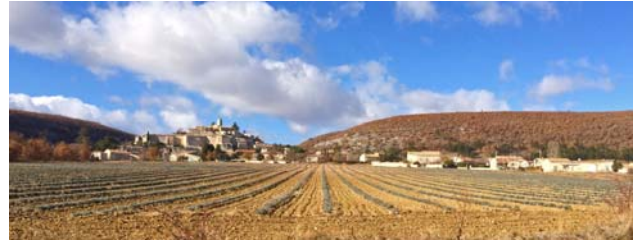
RD 12a depuis l'est, village perché et extensions récentes en concurrence visuelle