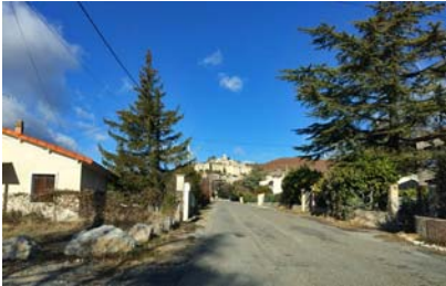
Pavillonnaire en approche du village Voie sans aménagement urbain