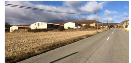
ZA banalisante en entrée de village