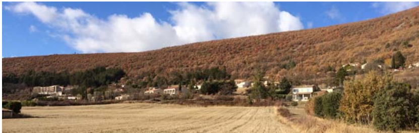
Extensions pavillonnaires à l'est du village sur plus de 1km