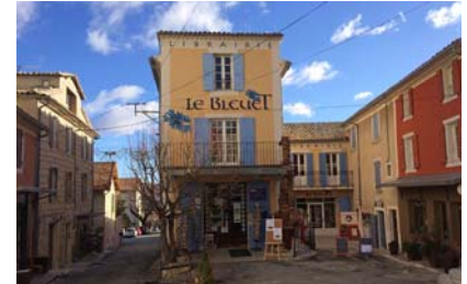
Commerces en centre ancien (dont une librairie réputée) et placettes