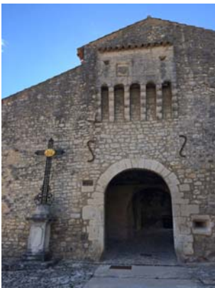
Portail à mâchicoulis percé dans les remparts (14 ème )

Village perché médiéval de caractère, signal paysager, reconnu, habité et visité