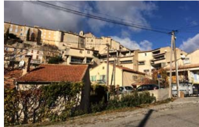
Bâti dense au pied du village ancien Réseaux aériens prégnants