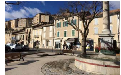
Belles façades des faubourgs dominées par le village médiéval

Village perché médiéval de caractère, signal paysager, reconnu, habité et visité