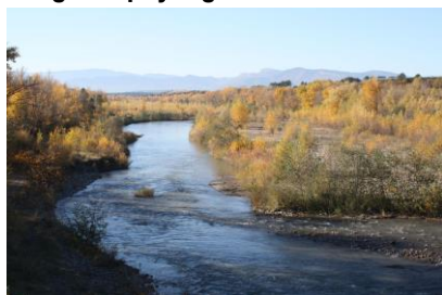
La Durance et sa ripisylve (Claret)