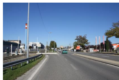
Zone industrielle et commerciale (Sisteron)