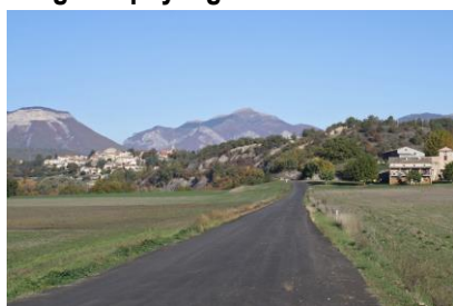
Village perché et fermes (Thèze)