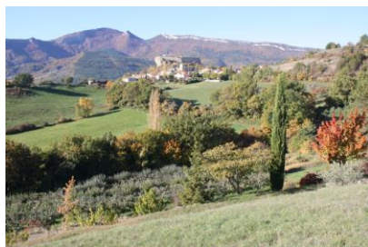
Polycultures de prairies et vergers (Mison)