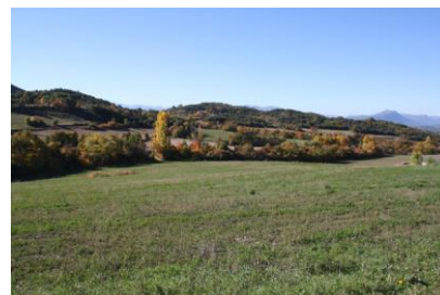
Prairies bocagères (Melve)