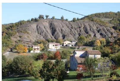
Extensions pavillonnaires (Claret)