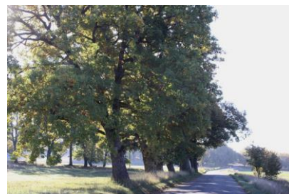
Beaux chênes pubescents (Vaumeilh)