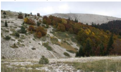
Pelouses et pierriers en crête de Lure (Saint-Etienne-les-Orgues)