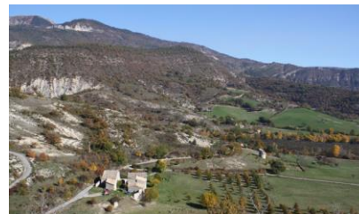
Ferme ancienne, maillage de haies et polycultures (St-Vincent-sur-Jabron)