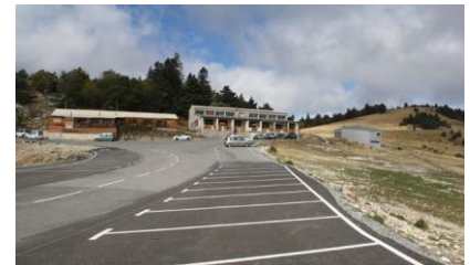
Station de ski de Lure (Saint-Etienne-les-Orgues)