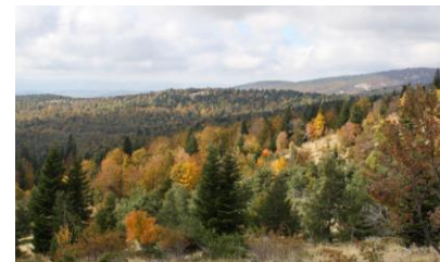
Versant sud de Lure boisé de hêtres et de reboisements en conifères (Saint-Etienne-les-Orgues)