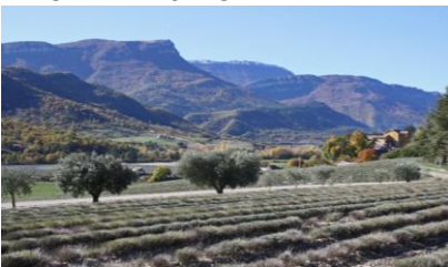
Paysage rural dominé par l'ubac de Lure (Noyers-sur-Jabron)