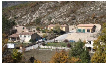
Lotissement récent en rupture avec les formes urbaines et architecturales locales (Saint-Vincent-sur-Jabron)