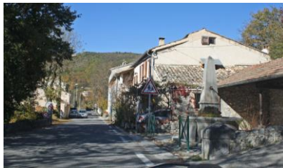
Village traditionnel en fond de vallée, lavoir et fontaine en premier plan (Noyer-sur-Jabron)