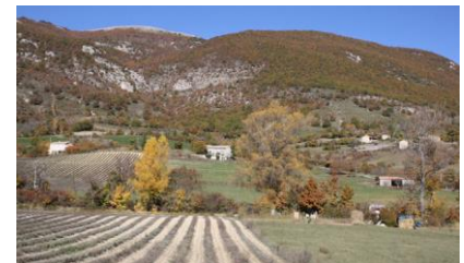
Habitat disséminé dans un patchwork de cultures (Les Omergues)