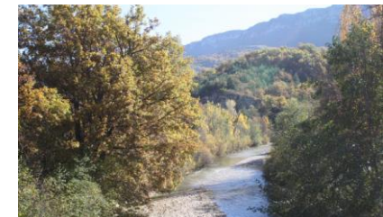
Ripisylve du Jabron et cordons de haies en fond de vallée (Saint-Vincent-sur-Jabron)